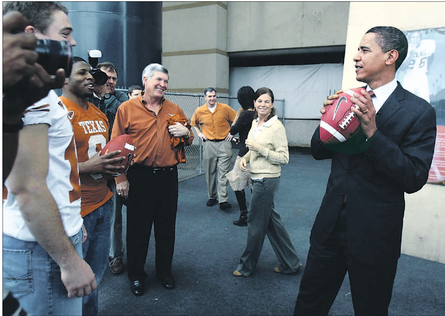
Barack Obama op campagne op de Universiteit van Texas in Austin.

Wat is Obama's geheim? Wie het tweede kantoor op 3rd Street beëindigt, krijgt een idee. Er huist een grassroots-groep met de fantasie-naam Alamobama. Het kantoor,