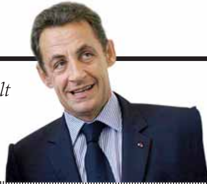
NICOLAS SARKOZY Franse president over het reddingsplan ter waarde van meer dan 1.870 miljard euro van Europese regeringen om de kredietcrisis aan te pakken, Financial Times , 14 oktober.

'Het grootste gevaar schuilt vandaag niet in roekeloosheid, maar in het niet durven nemen van risico's'